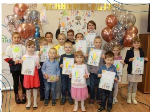
Семейный день в Челябинскстате

17 сентября в Челябинскстате прошел «Семейный день». Совместными силами актива Совета молодежи и Профсоюза Челябинскстата была организована познавательно-развлекательная программа. Детям показали мультфильмы о приключениях ВиПиНа и устроили творческие конкурсы. Позже для ребят провели экскурсию по Челябинскстату, где они посмотрели на рабочее место своих родителей, познакомились с коллегами родителей.